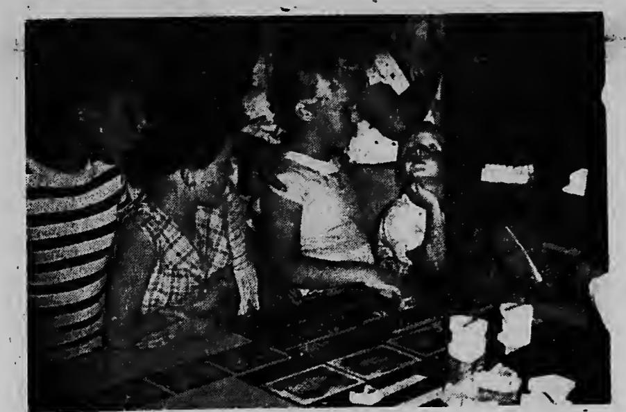
Vol belangstelling luistert de jeugd naar de vriendelijke dames en heren, die op de tandtentoonstelling in het Cecilia Theater te San Nicolas een hetsboek weten te vertellen over hoe je je tanden moet poetsen, en zo...

Nadat het rood-wit-blauwe lint in twee delen op de grond gevallen was, verspreidden de vele gasten